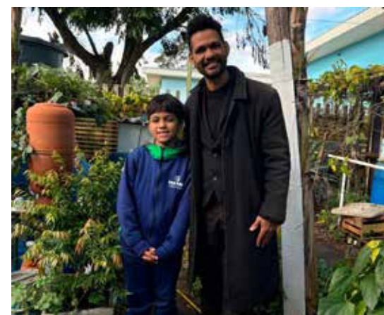
Jardim Secreto projeto une educação e meio ambiente em colégio da rede pública do Paraná

Um espaço que une natureza, leitura, sustentabilidade e convivência tem transformado a rotina dos estudantes do Colégio Estadual Manoel Ribas, na Vila Torres, em Curitiba. Criado há oito anos, o projeto Jardim Secreto se tornou uma referência em educação inovadora ao proporcionar experiências de aprendizagem que vão além da sala de aula.