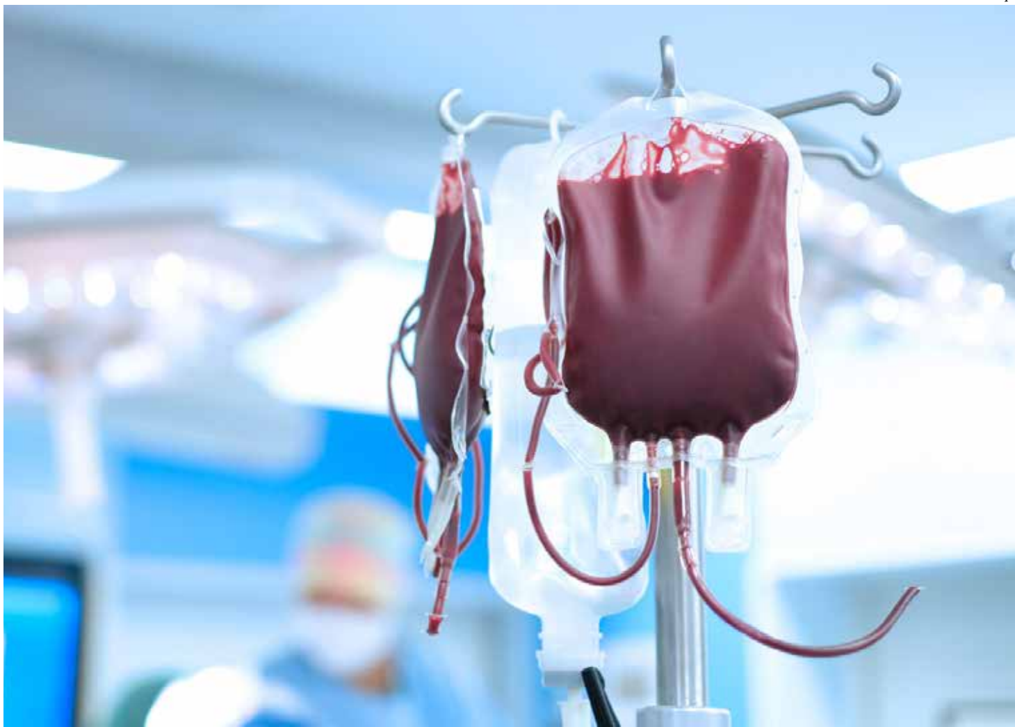
Cada doação é um gesto de solidariedade que pode salvar até quatro vidas. A doação de sangue é segura, rápida e essencial para manter os estoques dos hospitais e hemocentros sempre abastecidos