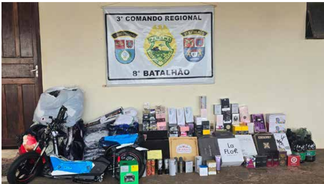
Carga apreendida pela Polícia Militar em Nova Esperança reunia produtos eletrônicos, perfumes, medicamentos, bebidas e vestuário. A ocorrência foi registrada na PR-463 e encaminhada à Receita Federal para os procedimentos cabíveis

Alex Fernandes França alexnoroste@hotmail.com