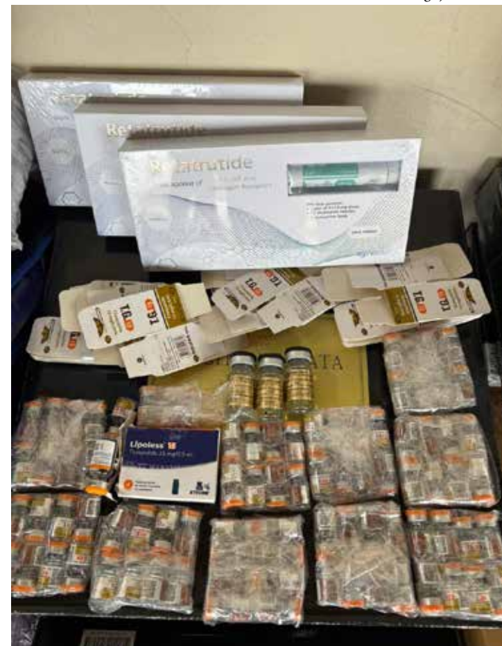
Entre os produtos apreendidos pela Polícia Militar estavam medicamentos e substâncias de uso controlado, incluindo ampolas de tirzepatida, canetas de retatrutida e frascos de testosterona. Todo o material foi encaminhado à Receita Federal de Maringá para os procedimentos legais