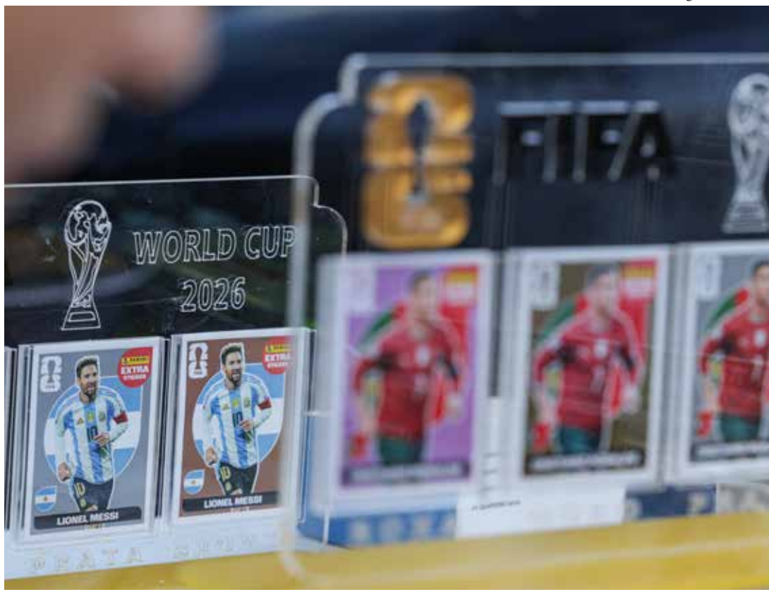
A procura pelas figurinhas da Copa do Mundo de 2026 movimentou colecionadores, vendedores e grupos de troca, transformando o álbum oficial em uma das tradições mais populares do Mundial

la última figurinha que falta para completar o álbum.