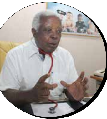
Por Dr. Juares de Oliveira – Médico ESF

• Evitar o sedentarismo e praticar exercícios físicos, mesmo que dentro de casa.