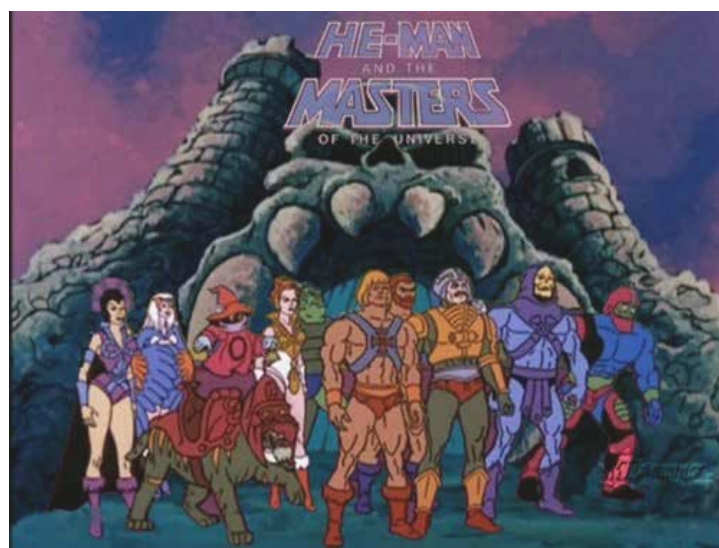
He-man e os Mestres do Universo – 1980

Em um dos seus primeiros diálogos com Maligna, após se tornar rei de Eternus, Esqueleto declara: