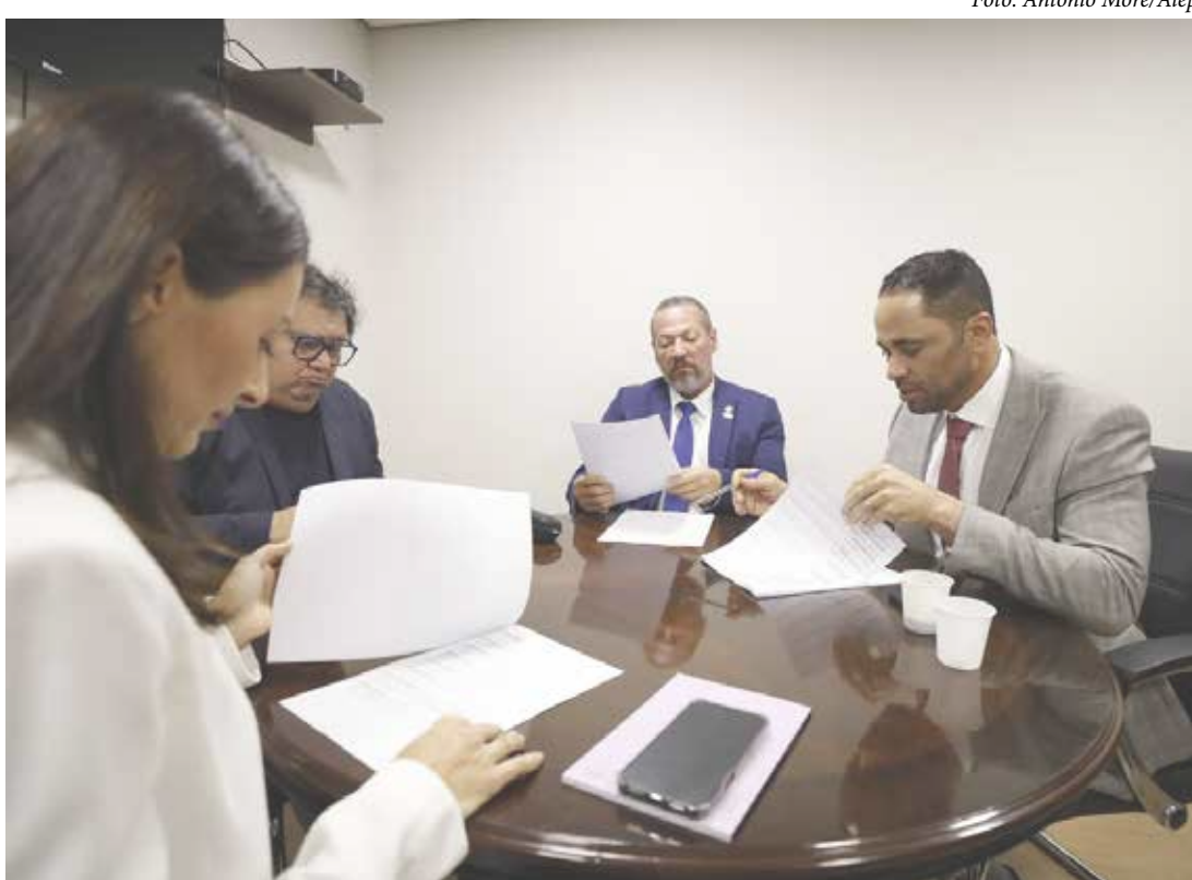
Reunião ocorreu antes das sessões plenárias desta segunda-feira (8)