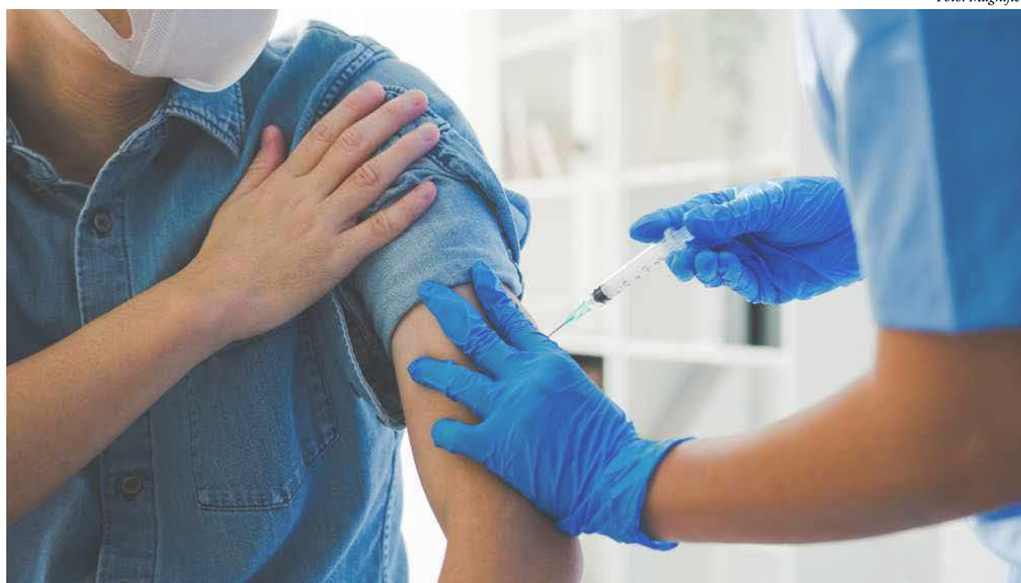
Diante da alta de Influenza A, especialista alerta para a importância da vacinação coletiva no Brasil

Segundo a especialista, a hesitação da população em se vacinar é alimentada por um fenômeno complexo: