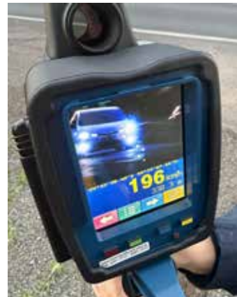
Radar da Polícia Rodoviária Federal registrou um veículo trafegando a 196 km/h na BR-277, em Paranaguá, durante a Operação Corpus Christi 2026. Segundo a PRF, o flagrante ocorreu na tarde de sábado (6) e exemplifica comportamentos de risco que contribuem para acidentes graves e mortes nas rodovias federais

grante exemplifica o comportamento de risco que contribui para a ocorrência