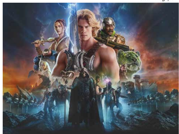
Os mestres do universo – filme de 2026

- Mate qualquer um que se aproximar, mulheres e crianças primeiro.