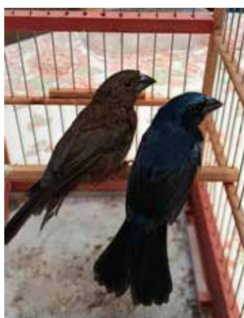
Aves nativas mantidas em cativeiro de forma irregular foram apreendidas durante fiscalização da Polícia Ambiental. A operação busca combater a captura e comercialização ilegal de pássaros retirados da natureza

A Polícia Ambiental destaca que a captura e a manutenção irregular de aves silvestres