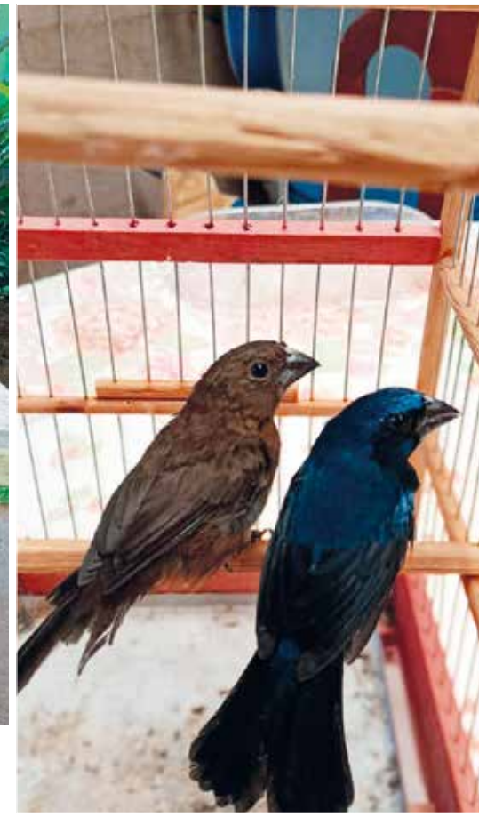
Materiais e aves apreendidos durante operação da Polícia Ambiental que investigou irregularidades na criação e manutenção de pássaros nativos em cativeiro. A ação resultou em autuações ambientais e termos circunstanciados

Uma operação realizada pela Polícia Militar Ambiental nesta semana resultou na