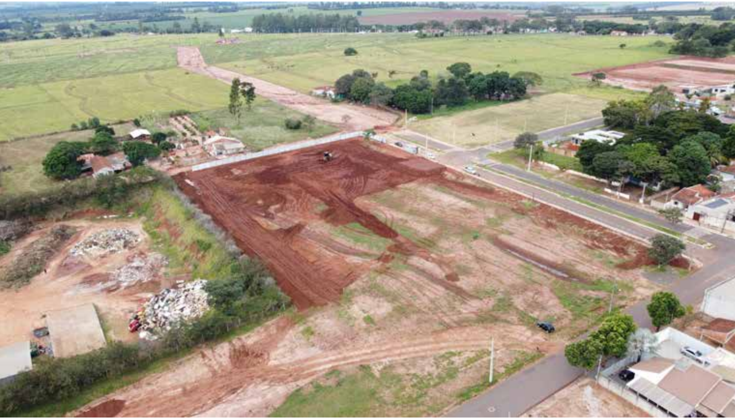
Área onde já tiveram início as obras de construção do novo Hospital Municipal, projeto de R$ 18 milhões que promete ampliar a capacidade de atendimento em saúde e fortalecer a estrutura hospitalar da microrregião de Nova Esperança

As obras de construção do novo Hospital Municipal de Nova Esperança já começaram e representam um marco histórico para a saúde pública do municí-