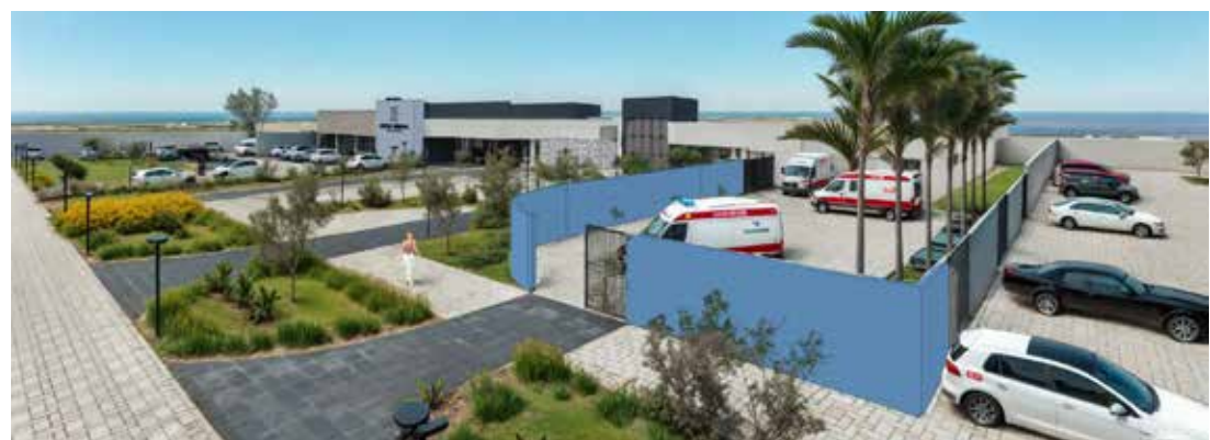
Imagem do projeto do novo Hospital Municipal apresenta a proposta arquitetônica da futura unidade, planejada para oferecer estrutura moderna, acessibilidade e ampliação dos serviços de saúde

A rede municipal também recebeu reforço profissional com a contratação de fisio-