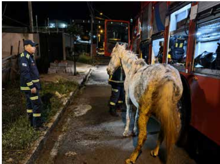
Equipes da Defesa Civil utilizaram cordas, amarrações e um tripé de resgate para retirar o cavalo que caiu em um bueiro de rede pluvial no Jardim Imperial, em Nova Esperança. A ocorrência foi registrada na madrugada desta quinta-feira (21)

Alex Fernandes França alexnoroeste@hotmail.com