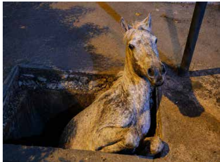
Cavalo ficou preso em um bueiro de rede pluvial no Jardim Imperial, em Nova Esperança, durante a madrugada desta quinta-feira (21). A Defesa Civil realizou o resgate utilizando técnicas de salvamento terrestre e conseguiu retirar o animal em segurança. O proprietário não havia sido localizado até o encerramento da ocorrência

Ocorrência foi registrada na madrugada desta quinta-feira (21), no Jardim Imperial, em Nova Esperança, onde o animal ficou parcialmente preso em uma galeria pluvial e precisou ser retirado com técnicas de salvamento terrestre.