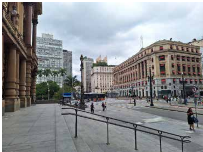
Centro de São Paulo visto a partir do Teatro Municipal

O escritor, cansado da vida de trabalhador da publicidade, comenta com a esposa, sua grande amiga e entusiasta, que gostaria de viver da literatura. Ela, segundo declarações em entrevista, não pensou duas vezes: vendeu, sem mesmo comentar, o carro que havia ganhado do marido e despejou o dinheiro na casa. Dali para frente, a vida do escritor, que sempre esteve diante das letras, seria uma pessoa mais livre na esfera literária, porém, o que não significa que não seria menos complexa. A vida é difícil e perigosa, dizia Riobaldo, só que a mesma vida presenteava o escritor com belas surpresas, que lhe propiciavam continuar voltado à escrita. Foi o caso da adaptação do "Sítio do Picapau Amarelo", de Monteiro Lobato. Lobato, não custa lembrar, foi amigo de seu pai, o "encadernador" de livros.