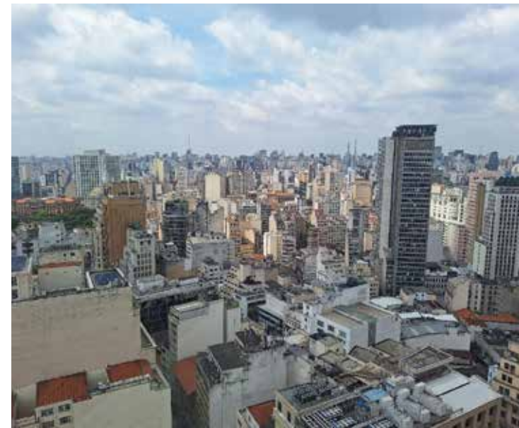
Centro de São Paulo visto a partir do Farol Santander

E onde, por fim, que um escritor encontra inspiração? Na vida, vivendo, sentindo as pessoas no dia a dia. As histórias de Rey se passam quase todas em São Paulo porque foi nessa cidade, e um pouco no Rio de Janeiro, que ele viveu. Hemingway dizia que o escritor deveria falar do que lhe era forte, próximo e verdadeiro. São Paulo era a verdade de Rey, a ela se dando a tal ponto de que suas cinzas foram lançadas, por sua cidade, sobre a selva de pedra do centro, um desejo seu. Por meu lado, eu posso dizer que Paranaíba e Maringá são minhas cidades. Maringá, diga-se de passagem, Marcos Rey já veio para falar de suas obras em escolas. De quê serve um escritor superficial? De quê serve um texto superficial? A leveza de Rey revela uma profundidade que pode enganar.