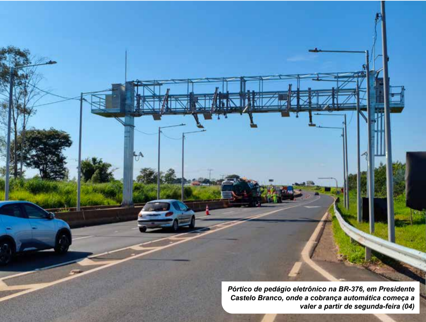
Pórtico de pedágio eletrônico na BR-376, em Presidente Castelo Branco, onde a cobrança automática começa a valer a partir de segunda-feira (04)

A partir da próxima segunda-feira, 4 de maio, entra em vigor a cobrança de pedágio eletrônico no trecho da BR-376 em Presidente Castelo Branco. O novo mo-