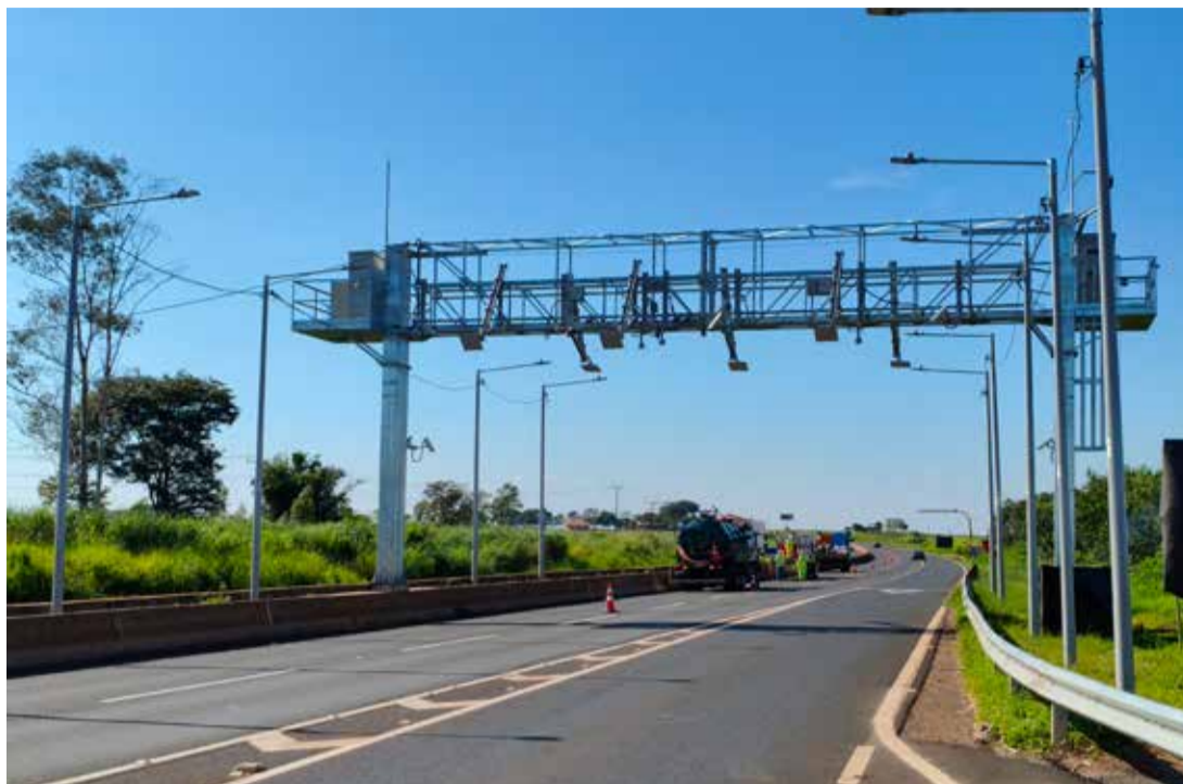
Pórtico de pedágio eletrônico instalado na BR-376, em Presidente Castelo Branco, passa a operar com cobrança automática a partir da próxima segunda-feira, sem necessidade de parada dos veículos

Sem cancelas ou praças físicas, o modelo realiza a leitura automática das placas ou de dispositivos eletrônicos, permitindo a passagem contínua dos veículos. Para automóveis, a tarifa na praça de Presidente Castelo Branco será de R$ 13,50, enquanto veículos de maior porte terão valores proporcionais ao número de eixos, podendo