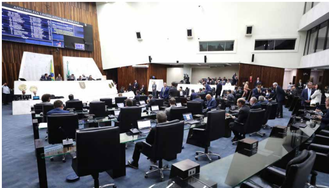
A proposta aprovada em Plenário estabelece que os repasses financeiros deverão ser destinados exclusivamente a investimentos na estrutura física e operacional das Guardas Municipais

A Assembleia Legislativa do Paraná aprovou uma iniciativa que autoriza o Estado a fortalecer as Guardas Municipais por meio da transferência de recursos financeiros e da doação de bens, materiais e equipamentos. A medida busca ampliar a capacidade operacional das corporações nos municípios e reforçar a segurança pública local. O texto integrou a pauta da sessão plenária desta segunda-feira (27).