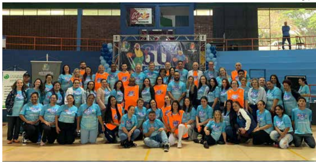
Os Jogos 60+ acontecem nesta quarta-feira, reunindo participantes da melhor idade em Nova Esperança

Consolidado como uma das principais iniciativas voltadas à terceira idade no Estado, o Jogos 60+ tem como objetivo promover o envelhecimento ativo, incentivando a prática de atividades físicas, a socialização e a melhoria da qua-