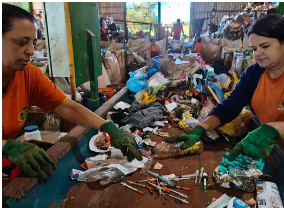
Trabalhadoras da Cocamare realizam a triagem dos recicláveis enquanto seringas descartadas de forma irregular surgem na esteira, evidenciando o risco diário de acidentes e a necessidade de conscientização sobre o descarte correto de materiais perfurocortantes

Ronan também observa que houve aumento no aparecimento dessas seringas nos últimos meses, possivelmente associado ao cres-