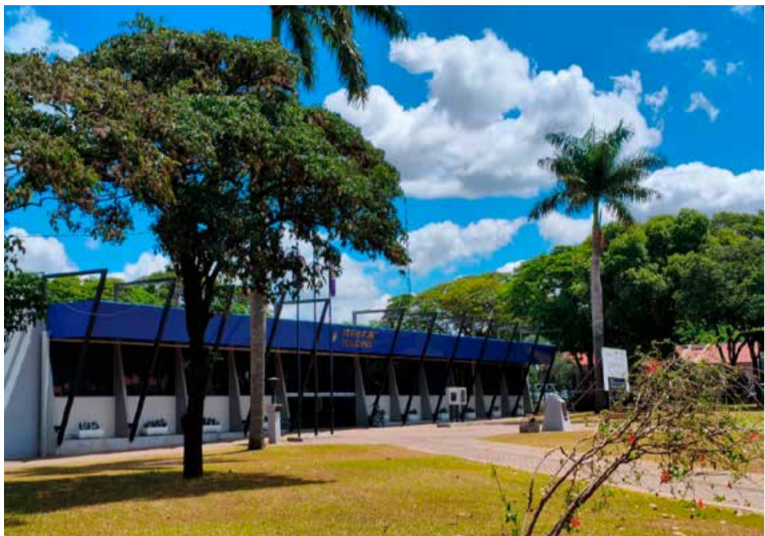
A Prefeitura de Santa Fé terá atendimento suspenso na próxima segunda-feira (20), véspera do feriado de Tiradentes, conforme decreto municipal; serviços essenciais serão mantidos