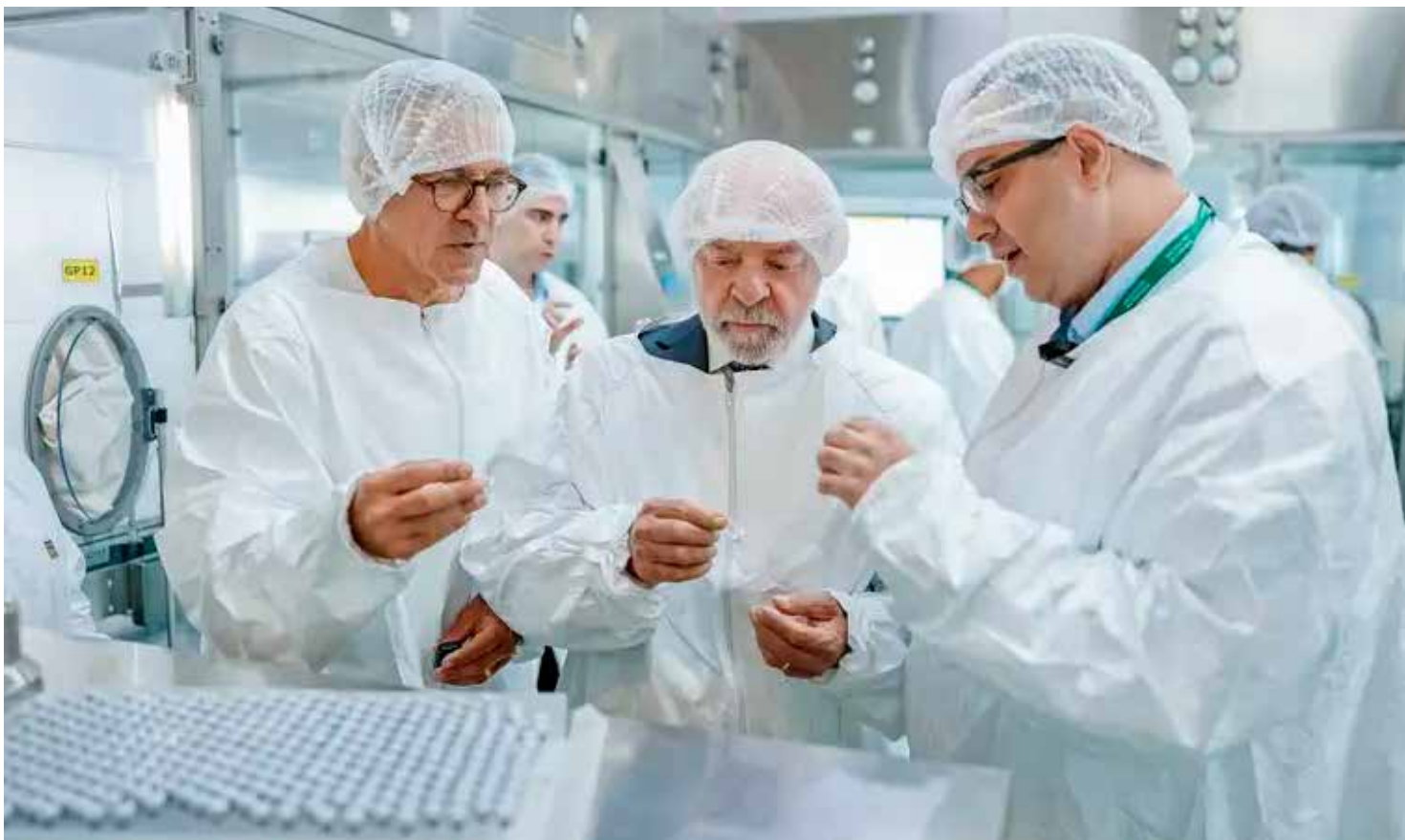
Presidente da República, Luiz Inácio Lula da Silva, e ministro da Saúde, Alexandre Padilha (esq), durante visita ao Centro de Produção de Vacina contra a Dengue (PVD) do Instituto Butantan

De acordo com a avaliação técnica da Anvisa, a Butantan-DV apresentou eficácia