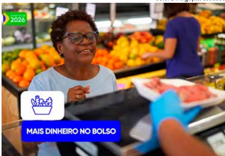
A isenção do Imposto de Renda para quem ganha até R$ 5 mil e a redução nos descontos para quem tem renda entre R$ 5 mil e R$ 7.350 beneficiam trabalhadores de todas as 27 unidades da Federação

TIPOS DE RENDIMENTO — Alguns tipos de rendimentos não entram nessa conta, como ganhos de capital, heranças, doações, rendimentos recebidos acumuladamente, além de aplicações isentas, poupança, aposentadorias por moléstia grave e indenizações. A lei também define limites para evitar que a soma dos impostos pagos pela empresa e