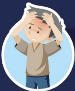
Dores de cabeça