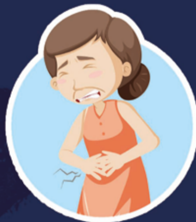
Dores na barriga