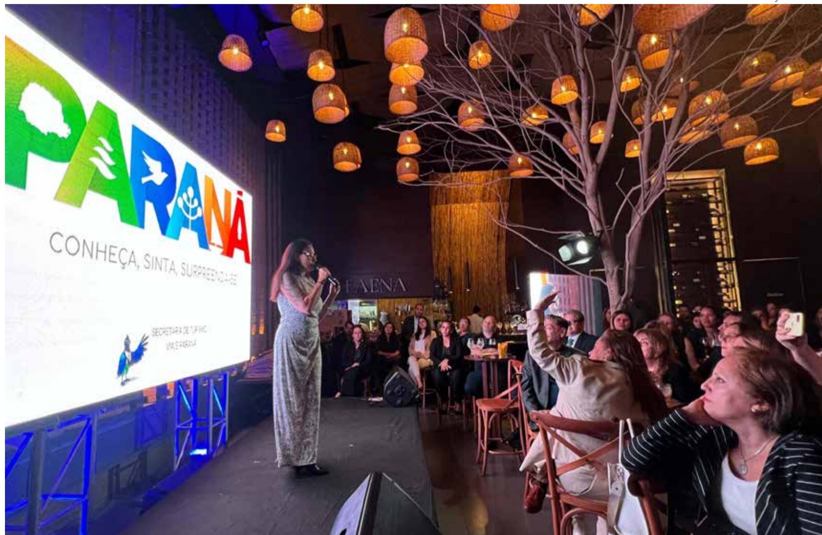
Viaje Paraná traz ao Estado cerca de 5,3 mil agentes de turismo de todo o Brasil em 10 Convenções

O Viaje Paraná, órgão de promoção comercial do turismo vinculado à Secretaria de Estado do Turismo, inova neste ano de 2025 ao trazer para o Estado cerca de 5,3 mil agentes do setor de todo o Brasil em 10 convenções.