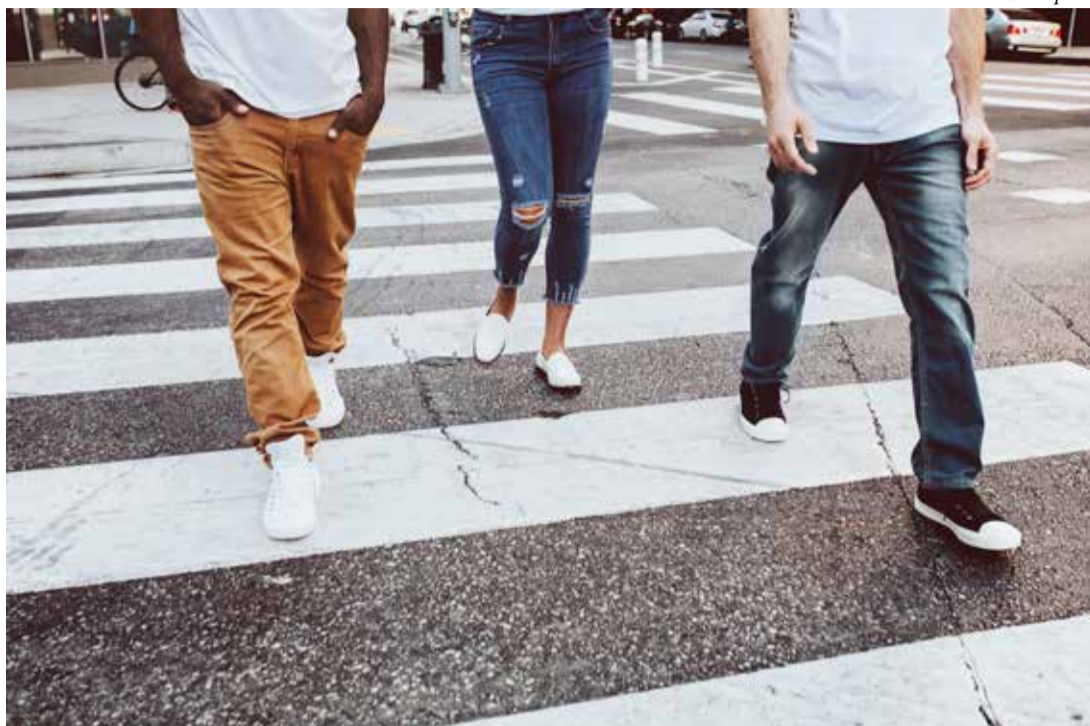
O Código de Trânsito Brasileiro (CTB) é claro: o pedestre tem prioridade ao atravessar a via, e os motoristas são obrigados a parar e permitir a passagem

Alex Fernandes França alexnoroste@hotmail.com