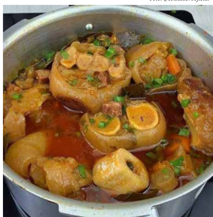
O mocotó é uma excelente fonte de colágeno, uma proteína muito importante para a saúde da pele, cabelos, unhas, ossos, sistema imunológico, articulações (reduz os riscos de artrose, osteoartrite, osteoporose) e ajuda a manter a elasticidade da pele

Portanto, o mocotó é um excelente fonte de colágeno,