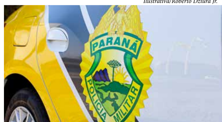
A Polícia Militar reforça a importância de denunciar casos de violência e de dirigir sob efeito de álcool, lembrando que essas atitudes colocam vidas em risco e são crimes passíveis de punição

A Polícia Militar reforça a importância de denunciar