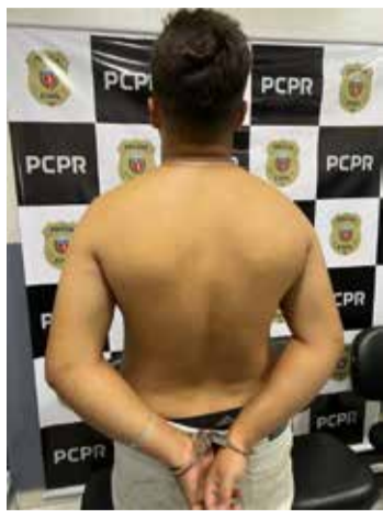
Homem preso em flagrante durante a operação realizada pela Polícia Civil, acusado de tráfico de drogas