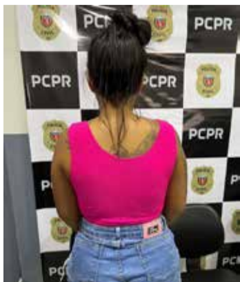
Mulher de 20 anos, namorada do indivíduo preso, também foi detida em flagrante por envolvimento no tráfico de entorpecentes durante a operação 'Não olhe para cima'

agentes envolvidos na ação. A presença de equipes de outras localidades foi fundamental para a eficácia da operação e para garantir a segurança de todos os envolvidos.