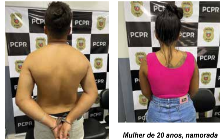
Homem preso em flagrante durante a operação, realizada pela Polícia Civil, acusado de tráfico de drogas