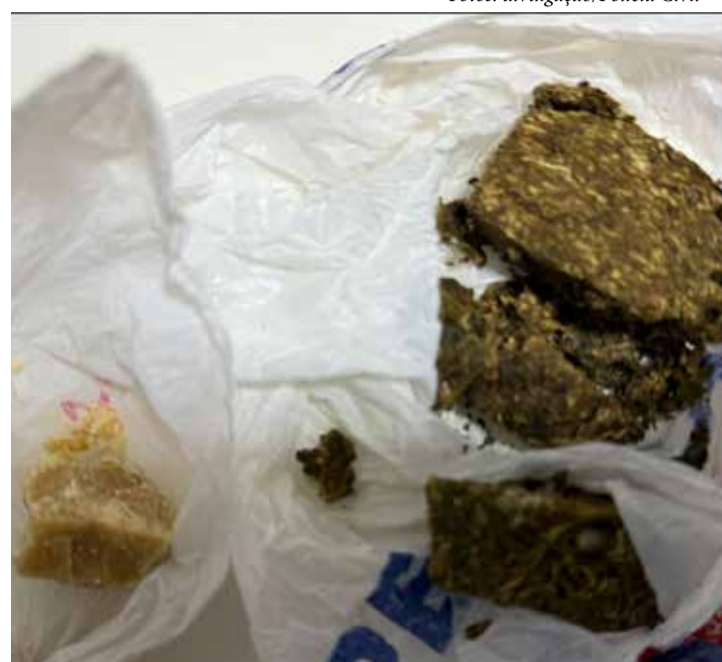
Porção de substâncias análogas à maconha e crack apreendidas pela Polícia Civil de Terra Rica durante a operação que resultou na prisão de um casal envolvido no tráfico de drogas

A Polícia Civil continuará a investigar o caso e a trabalhar para identificar possíveis outros envolvidos na rede de tráfico de entorpecentes na região.