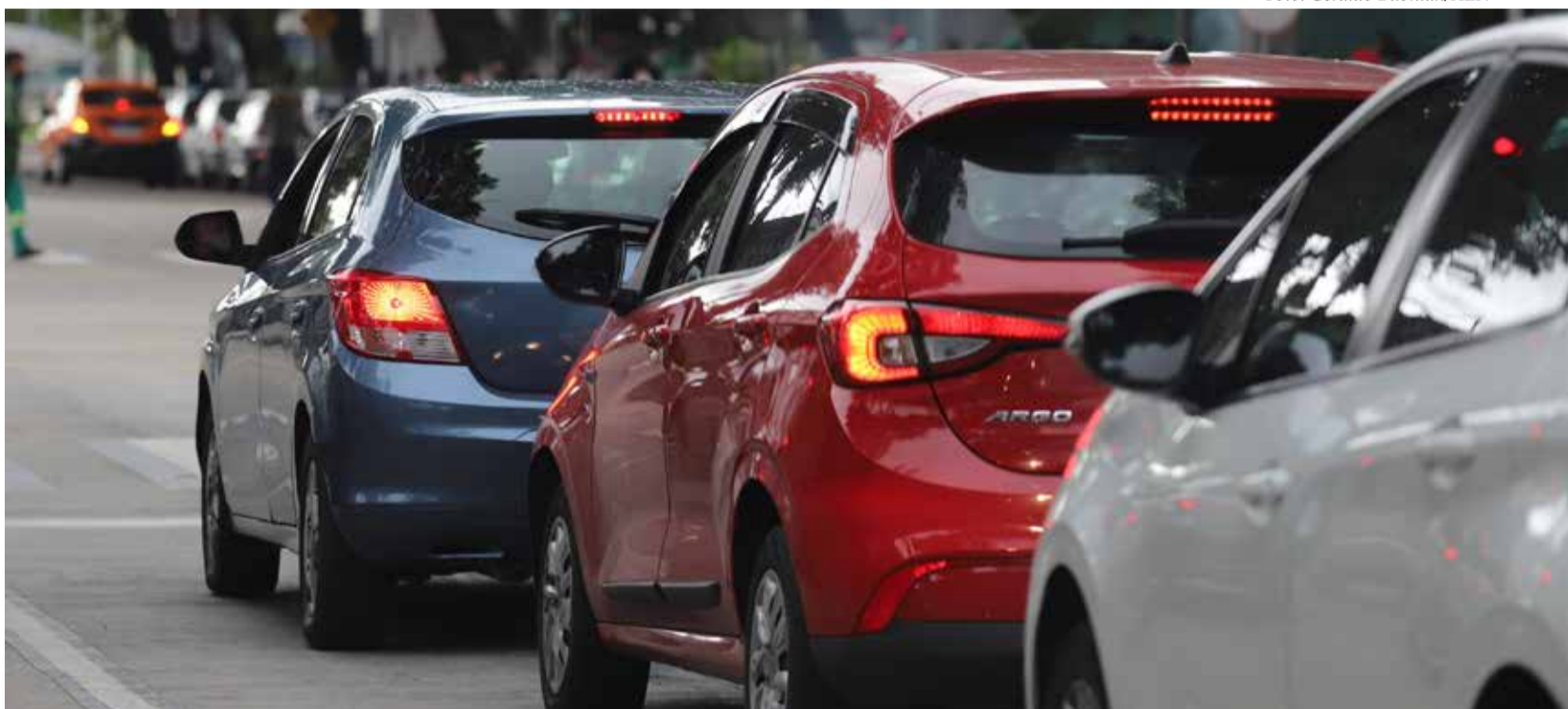
Calendário do IPVA 2025 é prorrogado; veja as novas datas

Os motoristas paranaenses terão alguns dias a mais para garantir o desconto de 6% do Imposto sobre a Propriedade de Veículos Automotores (IPVA) 2025. A Secretaria de Estado da Fazenda (Sefaz) e a Receita Estadual prorrogaram o início do calendário de pagamento do tributo para a próxima sexta-feira (24).