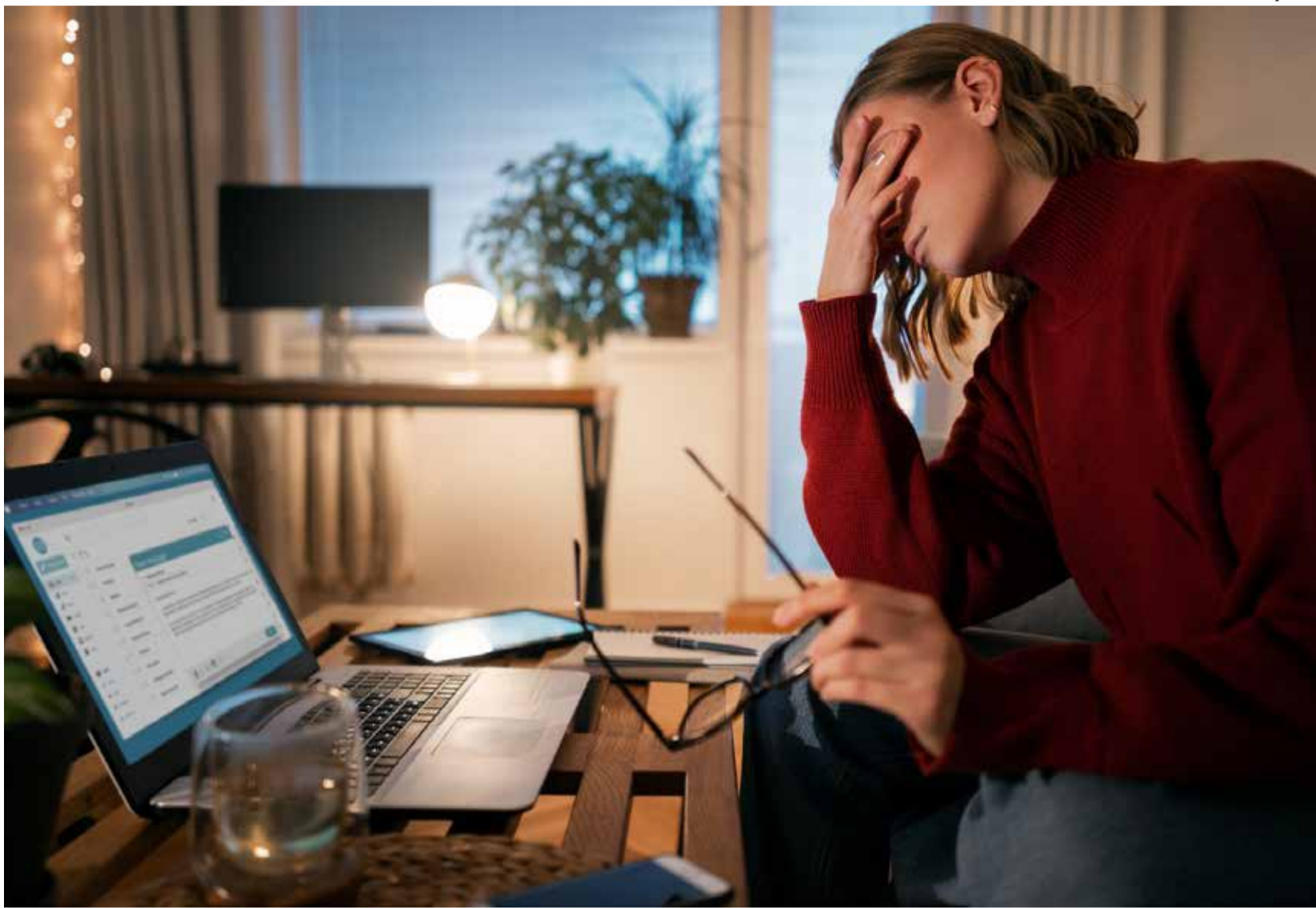
Home-office sem impor limite de horários e interação social pode causar burnout

coloca o trabalho nesse contexto, a casa também passa a ser vista como um espaço de pressão e de obrigação da empresa.