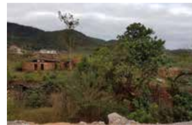
Distrito de Bento Rodrigues. É possível ver casas que foram destruídas pela barragem.