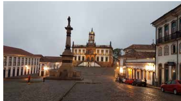
Praça Tiradentes, em Ouro Preto

Depois de Congonhas fomos à Belo Horizonte. Eu queria conhecer a arte de outro mestre brasileiro: Oscar Niemeyer. A Pampulha é uma obra de arte. Eu já conhecia outras obras do mestre, como Brasília, e sempre fiz questão de conhecer o que Niemeyer fez. Ficamos apenas um dia na capital mineira e então fomos a Ouro Preto.