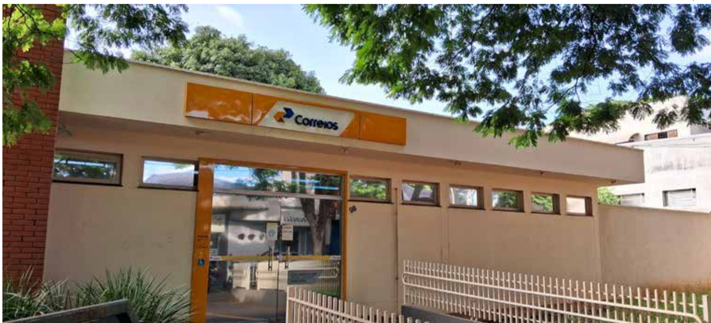
A agência dos Correios de Nova Esperança, localizada na Rua Pres. Castelo Branco, 98 - Centro, está comprometida em espalhar solidariedade e realizar sonhos neste Natal por meio da campanha Papai Noel dos Correios.

A agência de Nova Esperança reforça o convite à comunidade local: "Adote uma cartinha e faça a diferença na vida de uma criança. Neste Natal, seja você o Papai Noel que transforma sonhos em alegria!".