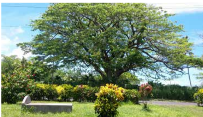
Túmulo no quintal de uma casa em Apia

Depois de findar a jornada em Fiji, fomos a Samoa. Neste país, logo ao chegarmos em Apia, notei um estranho costume: várias pessoas eram enterradas nos quintais da própria casa ou na de parentes. A ideia é a de que as pessoas devem ficar próximas dos seus, além do que, o hábito de cemitérios públicos era recente. Como é possível julgar uma cultura tão diferente? Nesse tipo de situação, julgar é tolher a compreensão.