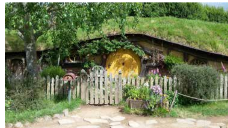
Casinha dos Hobbits