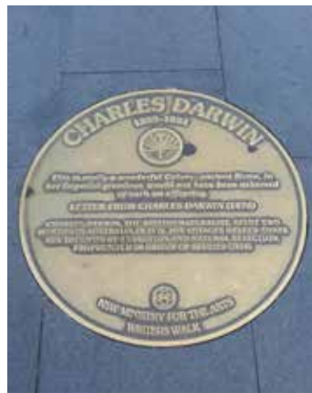
Placa de Darwin na “Calçada dos Escritores”

Enfim, próximo da Sydney Opera House há um monumento que gostei e que também existe em outros lugares do mundo: uma calçada de escritores. Há placas douradas ao longo de uma rua com nomes de escritores que passaram pela Austrália. Dentre os nomes há os de Charles Darwin, Mark Twain, Joseph Conrad e Umberto Eco. Foi emocionante. Eu já estive tanto na Bahia quanto no Rio