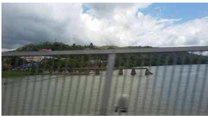
Enquanto passávamos pela ponte concluída, ao fundo estava a ponte pela metade

país tem 3 idiomas: fijiano, hindi e inglês.