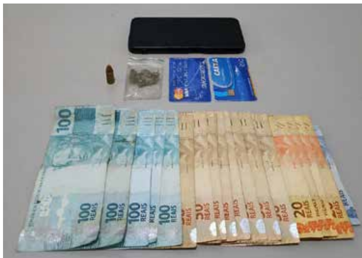
Os itens apreendidos incluem uma munição de calibre 9mm, dois cartões bancários furtados e uma pequena porção de maconha, que foram encaminhados à Delegacia de Polícia para investigação

Na tarde desta quinta-feira (03), por volta das 17h10min, a Polícia Militar de Nova Esperança prendeu um homem de 24 anos por posse irregular de arma de fogo e outros crimes. A prisão ocorreu durante um patrulhamento na Vila Regina, quando a equipe policial abordou o suspeito, que apresentava comportamento suspeito.