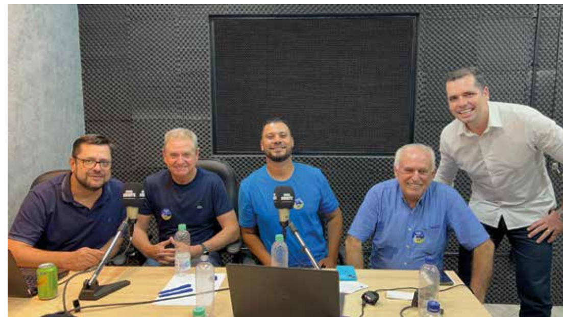
No estúdio do Jornal Noroeste: O prefeito eleito Eduardo Pasquini, o vice Carlos Roberto e o atual prefeito Moacir Olivatti, celebrando a vitória e discutindo os próximos passos para Nova Esperança após a apuração das Eleições Municipais. Na foto com a equipe de transmissão