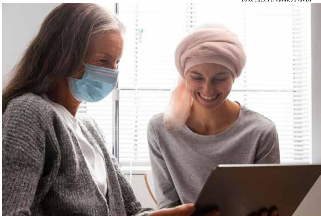
Outubro Rosa pretende reduzir a mortalidade da doença pela força de informações essenciais para prevenção e diagnóstico precoce

mais conhecidos está a idade, sendo mais comum em mulheres acima dos 50 anos. No entanto, estilo de vida e fatores ambientais também desempenham um papel importante. Alimentação inadequada, sedentarismo, consumo de álcool, tabagismo passivo, exposição a substâncias químicas e estresse são exemplos de fatores que podem contribuir para o desenvolvimento do câncer de mama.