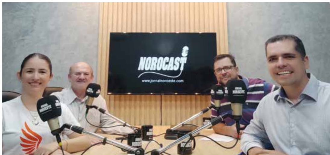
No episódio desta terça-feira (08) do NoroCast, representantes da Associação Ninho da Águia falam sobre o impacto transformador da entidade em Nova Esperança