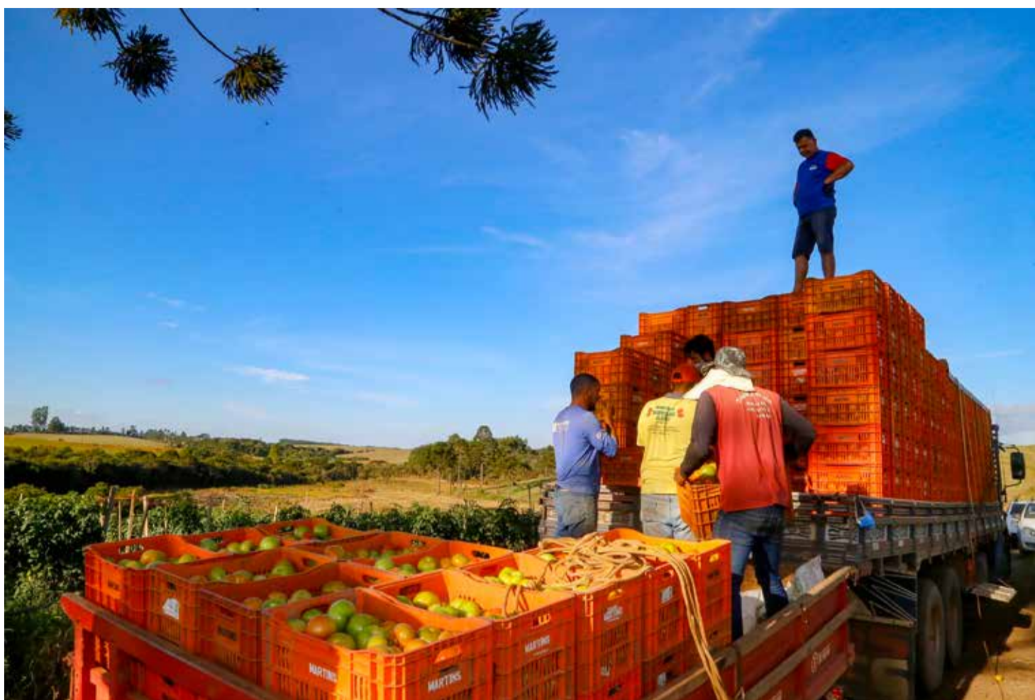
Plantação de tomate - 05-2021 Reserva-Pr

Entre as ações, estão o apoio ao fortalecimento das cadeias produtivas regionais, a melhoria da trafegabilidade no meio rural, compra de equipamentos e viabilização de iniciativas que promovem a segurança alimentar. A maior parte desse montante foi destinada à promoção da produção agropecuária, cuja ampliação foi de 450% em relação a 2023, com R$ 143,2