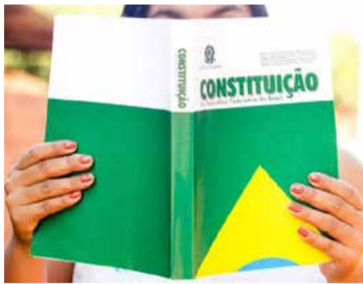
A educação é um ponto central da Constituição Federal de 1988.

A Coordenadoria de Gestão Municipal (CGM) afirmou que tal reenquadramento não é possível, pois afronta o disposto no artigo 37, II, da CF/88, o qual estabelece