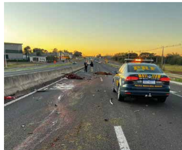
PRF atende ocorrência com cavalos na BR-376 e orienta o trânsito

O terceiro veículo envolvido, ocupado por trabalhadores do Prever, passou com uma das rodas sobre a cabeça de um dos cavalos, o que fez