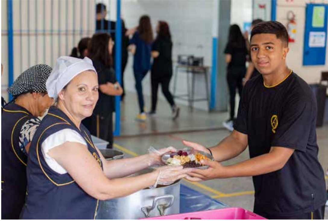
Governo amplia oferta de orgânicos na alimentação escolar no primeiro semestre de 2024

Uma novidade chegou à mesa dos alunos das escolas da rede estadual de ensino do Paraná no primeiro semestre de 2024: arroz e feijão orgânicos, mais uma iniciativa para tornar cada vez mais saudáveis as refeições servidas aos estudantes. Foram nada menos que 500 mil quilos de arroz e 100 mil quilos de feijão. Além disso, um a cada quatro alimentos que chegam às escolas vem da agroecologia e é produzido pela agricultura familiar.