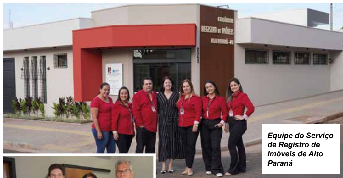
Equipe do Serviço de Registro de Imóveis de Alto Paraná