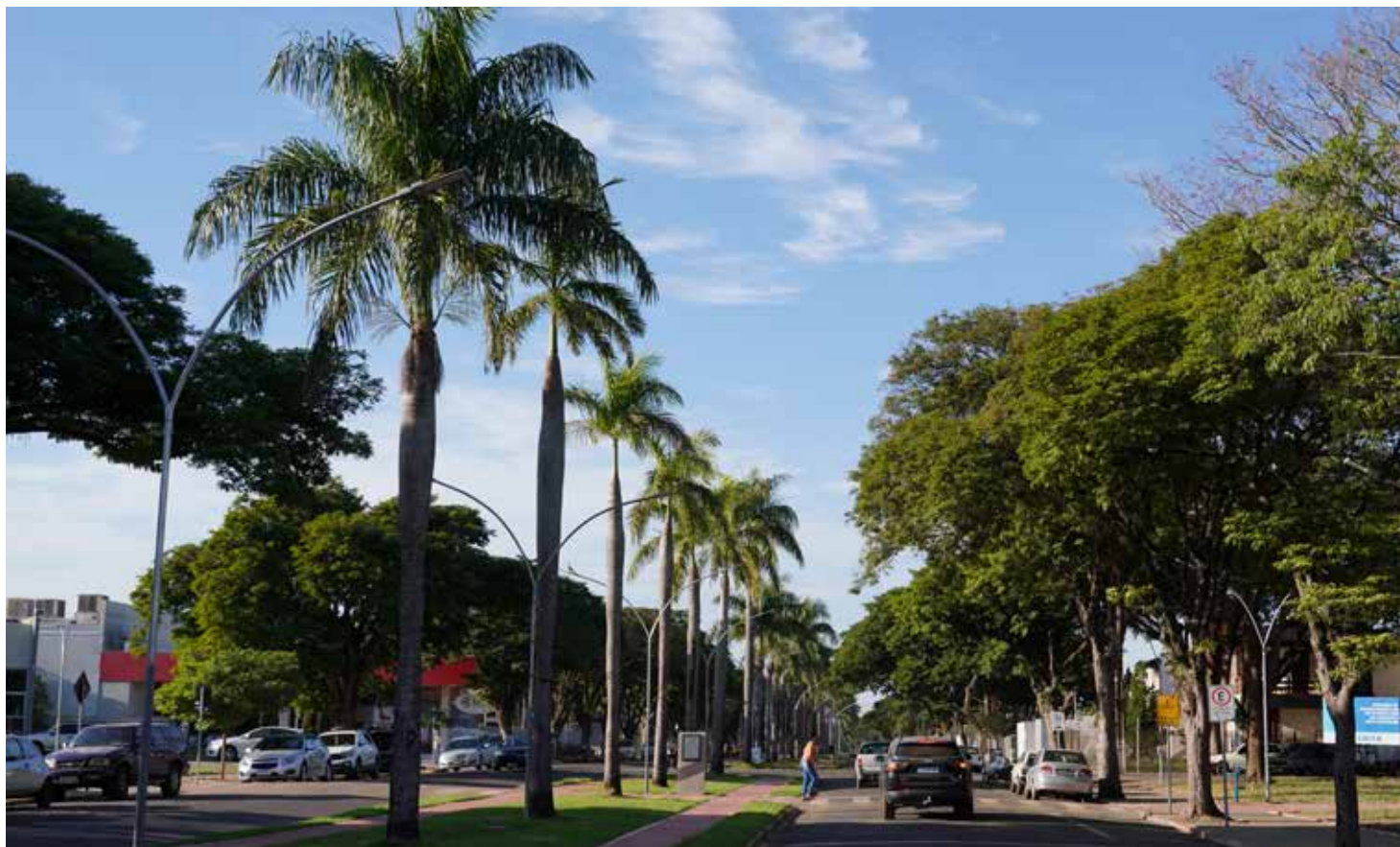
Nova Esperança: Fim de semana será de temperaturas variando entre 28°C e 31°C e mínimas em torno de 18°C a 20°C.