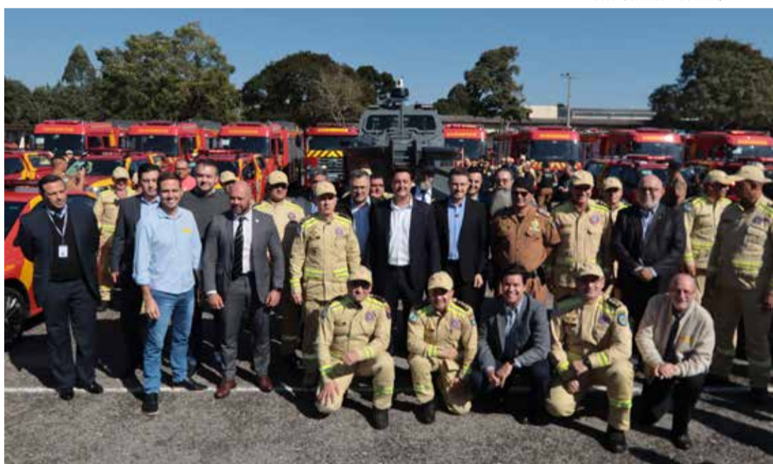
O governador Carlos Massa Ratinho Junior entregou nesta segunda-feira (3) 39 novos veículos para reforçar os trabalhos do Corpo de Bombeiros do Paraná.

de Segurança Pública, Hudson Teixeira, a modernização das forças de segurança têm um impacto direto para os cidadãos. “O Paraná vem registrando recordes históricos, com os menores índices de criminalidade dos últimos anos. Isso se dá graças ao empenho dos nossos policiais, bem como por conta do aumento nos investimentos em equipamentos e tecnologia”, disse. Na comparação entre os quatro primeiros meses de 2024 com o mesmo período de 2023, o Paraná registrou uma queda de 12,6% no número de homicídios, caindo de 675 ocorrências para 590. Nos roubos, a redução foi de 25,8%, saindo de 8.837 registros de janeiro a abril de 2023 para 6.559 em 2024. Já na apreensão de drogas, o aumento foi de 15,2%, com 90,3 toneladas apreendidas neste ano e 78,4 toneladas apreendidas no mesmo período do ano passado.