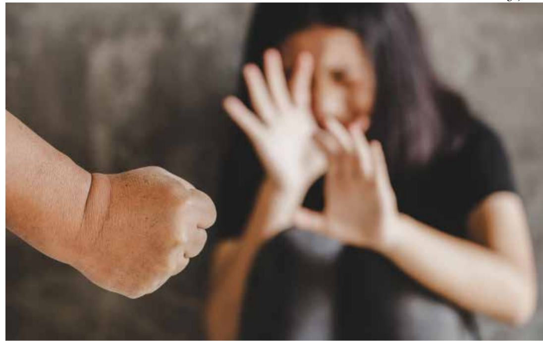
O caso aconteceu na tarde de domingo (02) em Alto Paraná

O Jornal Noroeste continuará acompanhando o desenrolar deste caso e fornecendo atualizações à medida que novas informações forem divulgadas pelas autoridades.