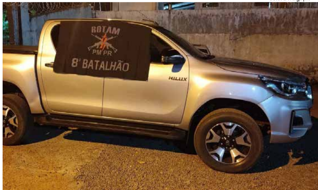
Caminhonete Toyota Hilux prata, furtada em Apucarana, recuperada pela Polícia Militar

Durante a patrulha, os policiais avistaram a caminhonete no local indicado e realizaram a abordagem. Após a verificação, foi constatado que o veículo possuía alerta de furto. O condutor, um homem de 29 anos, foi imediatamente detido e recebeu voz de prisão.