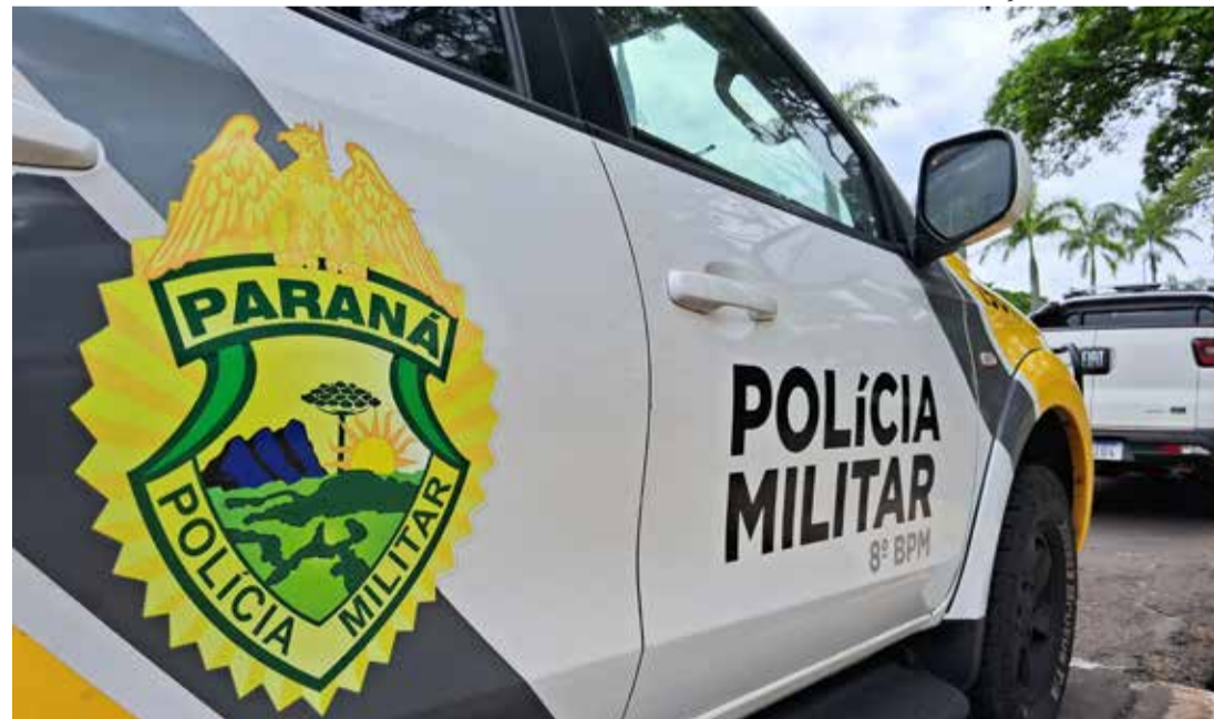
A ação ocorreu durante patrulhamento de rotina da Polícia Militar