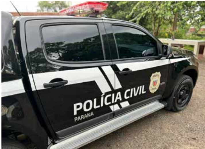
Segundo informou a Polícia Civil, os suspeitos serão indiciados por receptação, crime que pode resultar em penas de até oito anos de prisão

indiciados por receptação, crime que pode resultar em penas de até oito anos de prisão, conforme o Código Penal Brasileiro.