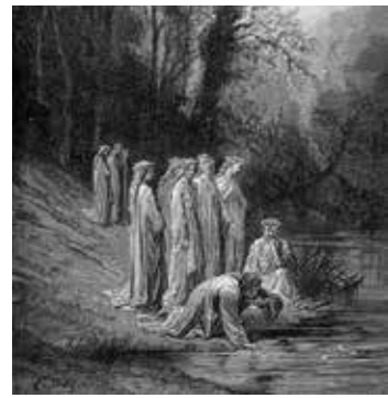
Representação de Gustave Doré. Canto XXXIII. Dante e Estácio (poeta romano) bebem as águas do rio Eunoe em companhia das ninfas que servem Beatriz no Paraíso Terrestre. Este rio restaura as memórias apagadas pelo rio Letes, deixando apenas as boas ações praticadas.

A opinião do colunista não reflete, necessariamente, a do Jornal Noroeste