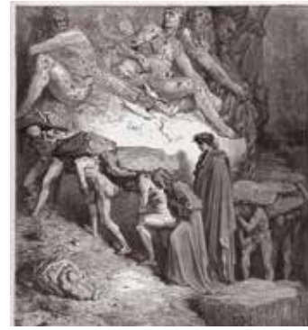
Representação de Gustave Doré. Canto XI. Os orgulhosos carregando pedras pesadas.

a parte oriental toda rosada corar, do azul do céu sereno adorno; e a face do Sol nasceu velada tanto, que pelo efeito dos vapores, sustentá-la podia minha mirada; assim, em meio a uma novem de flores que, de angélicas mãos, subia festiva e retombava espargindo candores, sobre um véu níveo cingida de oliva, dama me apareceu num verde manto sobre as vestes da cor de chama viva; e o espírito meu que, desde tanto tempo, não fora mais por sua presença arrebatado, já a tremer de espanto, sem ter pela visão sua conchecção, mas, por efeito que dela partiu, de antigo amor senti a força imensa.