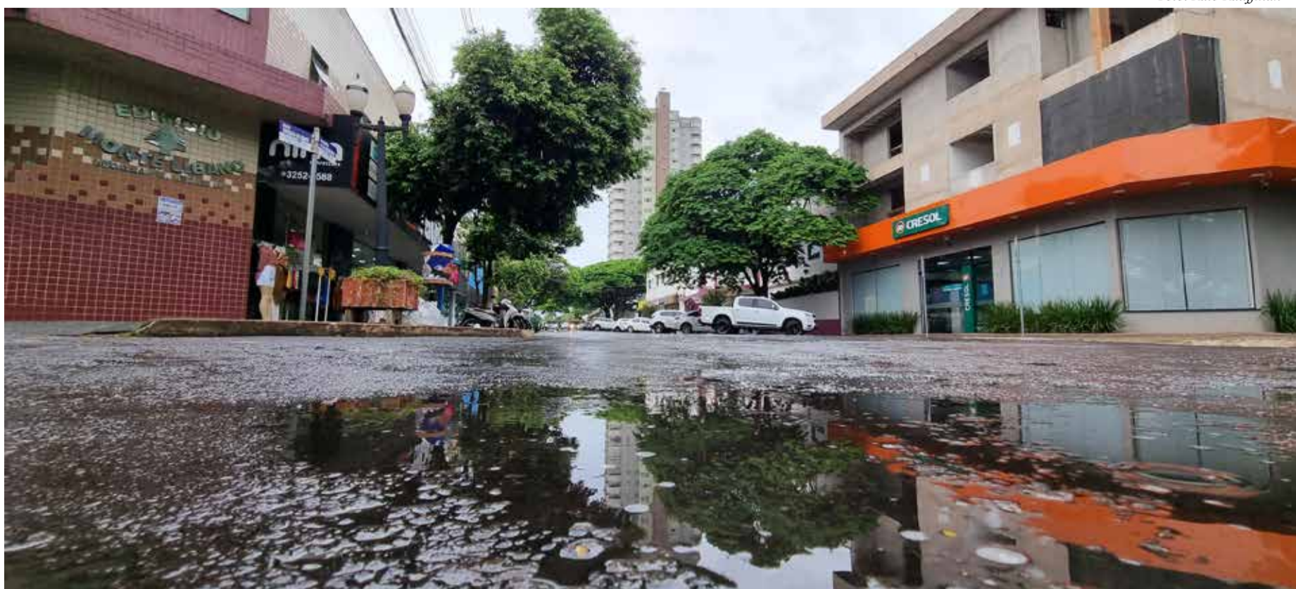
Assim como na segunda-feira, o dia em Nova Esperança será marcado por sol com muitas nuvens pela manhã e pancadas de chuva à tarde.