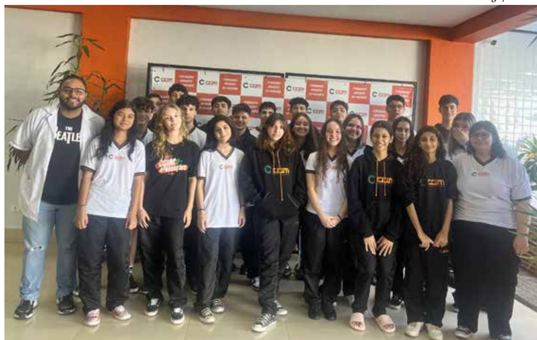
Alunos da 2 série A do Colégio Cristão Integrado de Maringá

A miscigenação brasileira, embora tenha contribuído para a formação de uma cultura rica e diversificada, também está impregnada de complexidades e problemas subjacentes. Um dos principais aspectos criticáveis do processo de miscigenação é