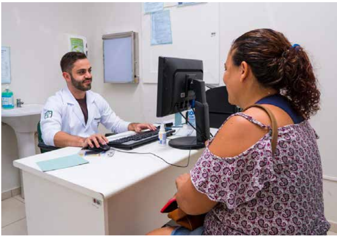
Em Maringá, cerca de 70% dos atendimentos de saúde poderiam ser realizados com consultas nas UBSs, que contam com médicos e equipe de enfermagem

As UBSs funcionam como a porta de entrada do SUS. Nos locais, são atendidos pacientes que não estão em estado grave, como febre de até 38°C, dores de cabeça, resfriado, curativos, medicações, vacinas, exames rápidos, consultas e outros atendimentos. Nos casos de sintomas de dengue como febre; dor muscular e/ou nas articulações; dor atrás dos olhos; dor de cabeça; náusea e vômito e manchas averme-