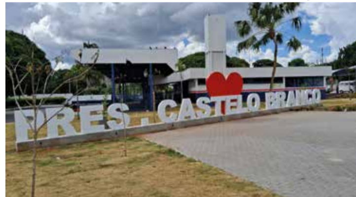
No próximo sábado, 16 de março, a Prefeitura de Presidente Castelo Branco convida toda a população para participar do Dia D contra a Dengue

A campanha tem como lema "Com saúde não se brinca" e traz slogans como "Fora o mosquito", "Minha cidade sem o mosquito" e "Prevenir é proteger". As orientações aos moradores incluem a limpeza antecipada dos quintais, o descarte adequado de materiais que possam servir de criadouro para o mosquito da dengue e a colaboração para recolhimento desses materiais pelas equipes responsáveis.