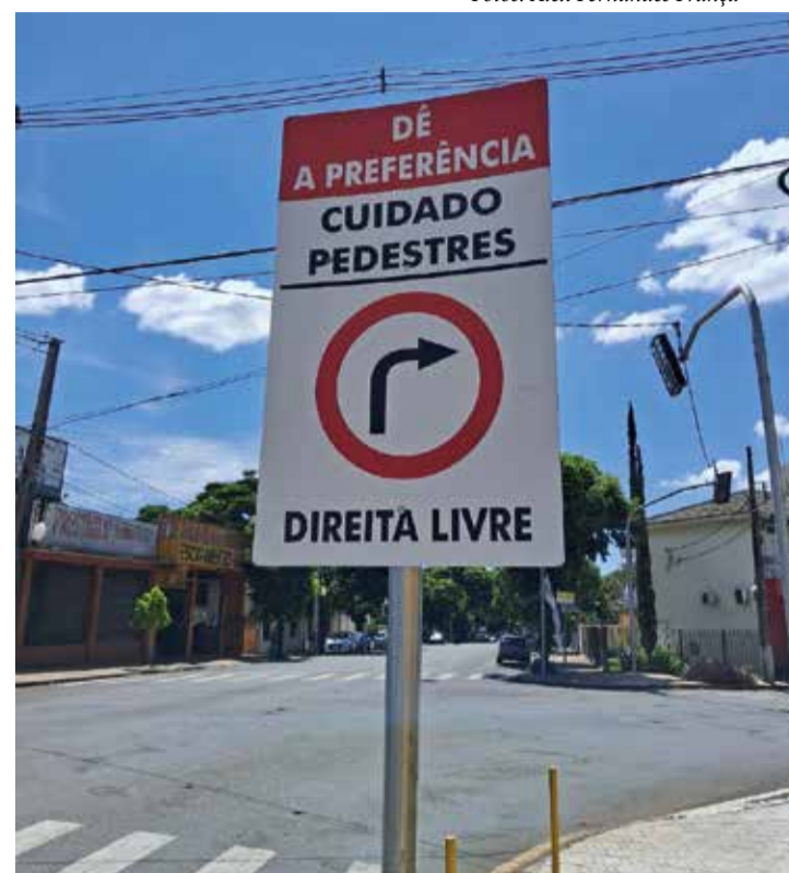
A sinalização, que permite a conversão à direita mesmo com o semáforo vermelho, visa agilizar o fluxo de veículos, mas muitos condutores ainda não se adaptaram à nova regra ou a ignoram completamente