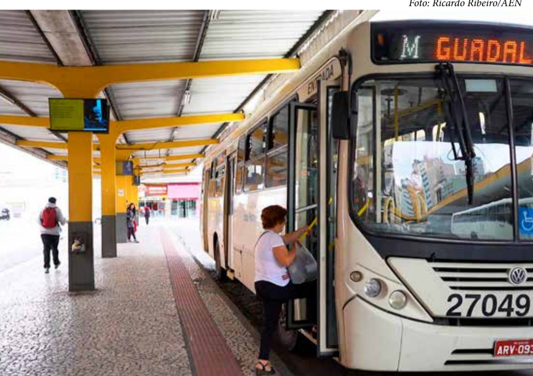
Agências do Trabalhador começam a cadastrar usuários para o Cartão Social do Governo do Estado

Para receber os créditos, o usuário deve estar cadastrado no CadÚnico e no Sistema Nacional de Emprego (Sine), além de atender critérios como baixa renda e ter idade entre 16 e 64 anos.