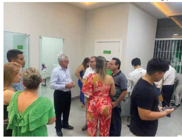
Os presentes puderam desfrutar de deliciosos coquetéis, promovendo momentos de confraternização e networking entre autoridades, empresários locais, familiares e amigos dos profissionais que passam a atender na Odonto Company

autoridades, empresários locais, familiares e amigos dos profissionais que passam a atender na Odonto Company.