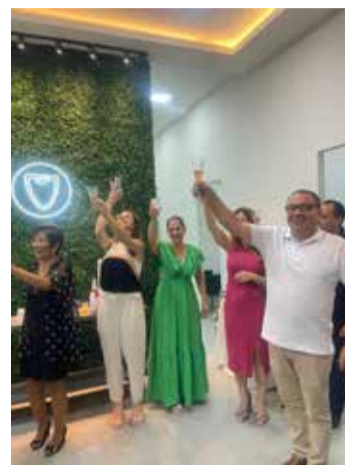
As amplas instalações foram festivamente inauguradas na noite de sexta-feira (23)

Odonto Company Avenida São José – Centro Nova Esperança