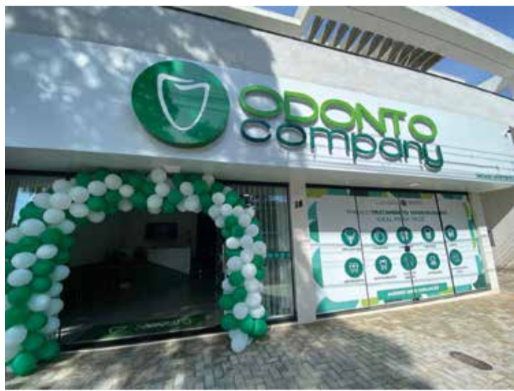
As modernas instalações da Odonto Company foram oficialmente inauguradas em Nova Esperança na última sexta-feira (23)

Diversos empresários da cidade estiveram presentes, representando empresas locais como Supermercado Mulati, Ótica e relojoaria Eska, Auto Mecânica Maran e Granja Takakura. A presença