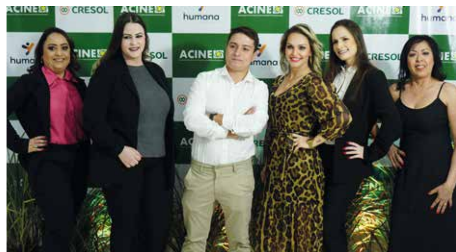
Equipe de colaboradores da Acine