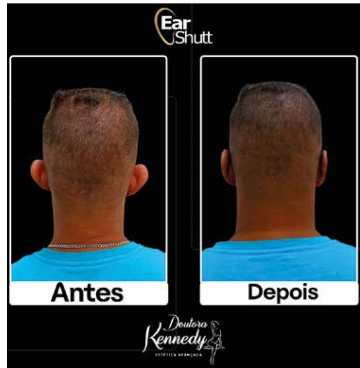
Mudança de vida - a correção das orelhas abertas, conhecidas popularmente como orelhas de abano, que são motivo de incômodo e constrangimento para muitas pessoas.