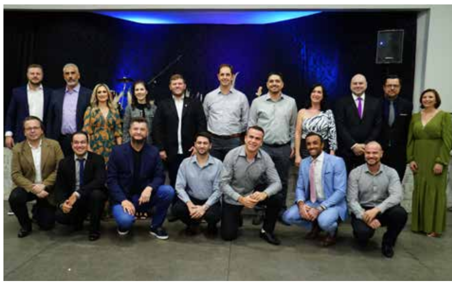
Os Conselhos Administrativo e Fiscal Efetivo foram devidamente empossados