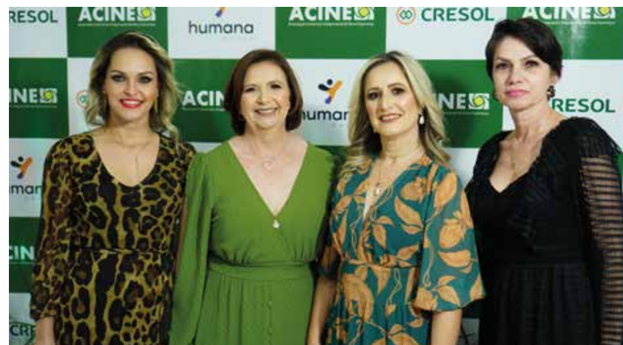
Humana Saúde – Empresa patrocinadora